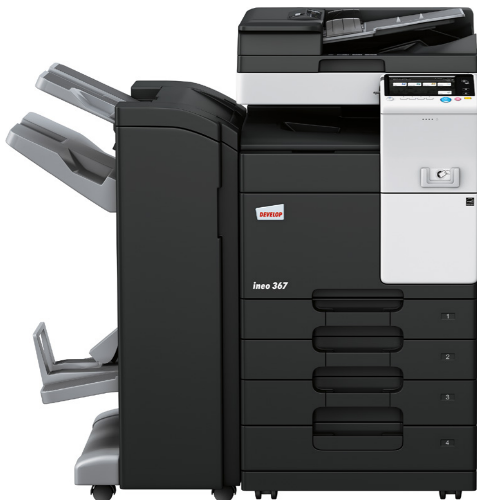
ineo 367 s oboustranným podavačem originálů (DF-628), brožovacím finišerem (FS-534SD), dvěma přídatnými kazetami (PC-213) a bezkontaktní čtečkou karet

Úřady, školy a univerzity, kanceláře architektů, pojišťovny, banky, knihovny: spousta malých nebo středních firem ve skutečnosti nepotřebuje tisknout barevně. Zaměstnanci těchto organizací často potřebují černobílé multifunkční zařízení, které se snadno používá a nabízí pestrou škálu mobilních funkcí.