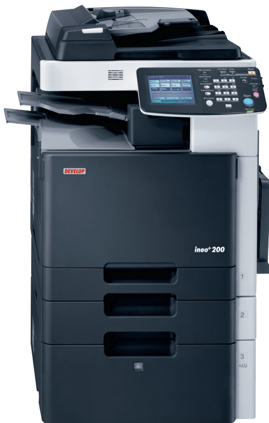
ineo + 200 s podavačem originálů DF-612, přihrádkou pro oddělování úloh JS-505, vícenásobným ručním podavačem MB-502, kazetou na papír PC-105 a velkokapacitním zásobníkem PC-405

ineo + 200 elegantně roztančí dokumenty z každodenní kancelářské rutiny při skenování a faxování. Můžete naskenovat několik stránek současně a nalézt je ve Vašem emailu nebo přímo ve Vašem počítači nebo na jiné adrese, kterou si sami definujete. Možné formáty nasnímaného dokumentu jsou PDF, TIFF nebo JPG – všechny které jste kdy potřebovali. Volitelný fax mění ineo + 200 ve velmi rychlý faxový systém zatímco volitelný podavač originálů šetří Váš čas při faxování nebo skenování vícestanných dokumentů. ineo + 200 je právě to, co je třeba pro rychlou firemní komunikaci.