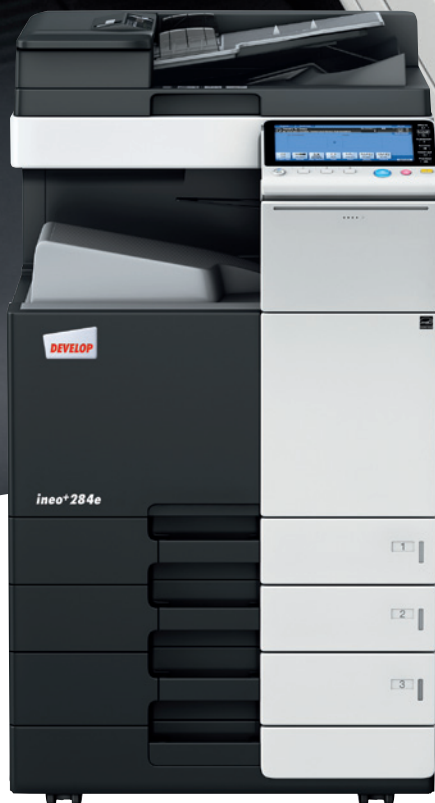
ineo+ 284e s podavačem papíru (PC-210) a duálním jednorůchodovým podavačem originálů (DF-701)