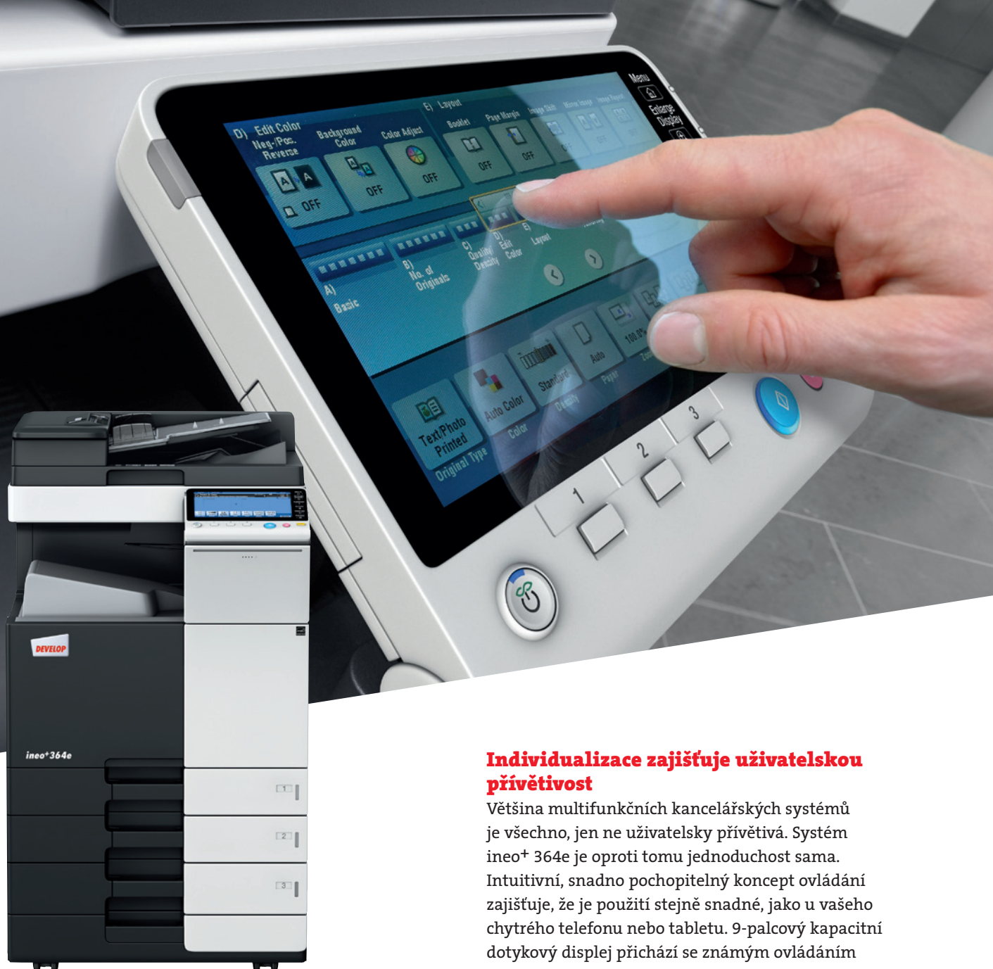
ineo+ 364e s podavačem papíru (PC-210) a duálním jednorůchodovým podavačem originálů (DF-701)