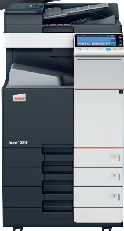
ineo+ 284 s kazetou na papír (PC-110) a jednopřechodovým podavačem originálů (DF-701)