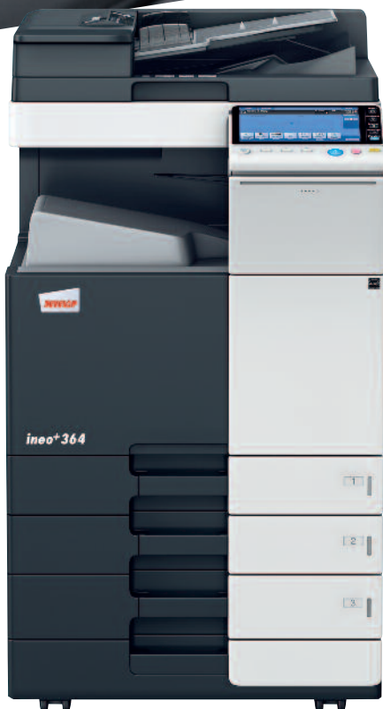
ineo+ 364 s kazetou na papír (PC-110) a jednopřechodovým podavačem originálů (DF-701)