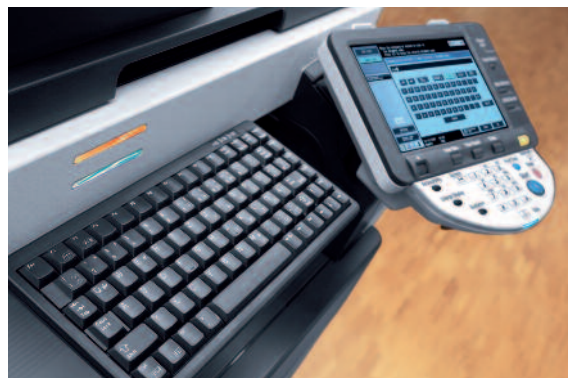
Barevná dotyková obrazovka systému ineo 283 a jeho volitelná klávesnice

Perfektní tým: Zařízení ineo 283 můžete využívat pro Váš černobílý tisk a kopírování, zatímco barevné systémy ineo+ Vám zaručí profesionální barevný výstup - získáte tak nákladově efektivní kombinaci pro tvorbu vysoce kvalitních kancelářských dokumentů.