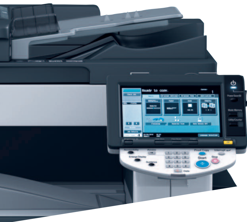
barevný dotykový displej pro snadnou obsluhu zařízení ineo 283

Vysoká kvalita tisku a kopírování je zajištěna polymerovaným tonerem 2. generace, který zajišťuje laserově ostrý text a velmi plynulé odstíny šedi. Výsledné kopie jsou tak výrazné, zřetelné a velmi kvalitní.