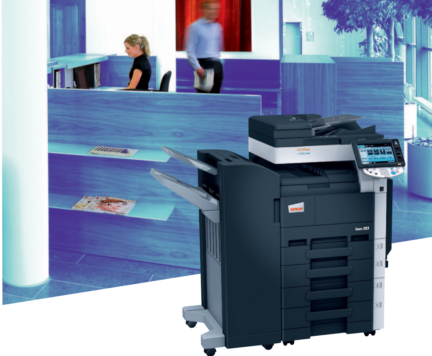
ineo 283 s podlahovým finišerem (FS-527), dvojitou kazetou na papír (PC-208) a podavačem originálů (DF-621)