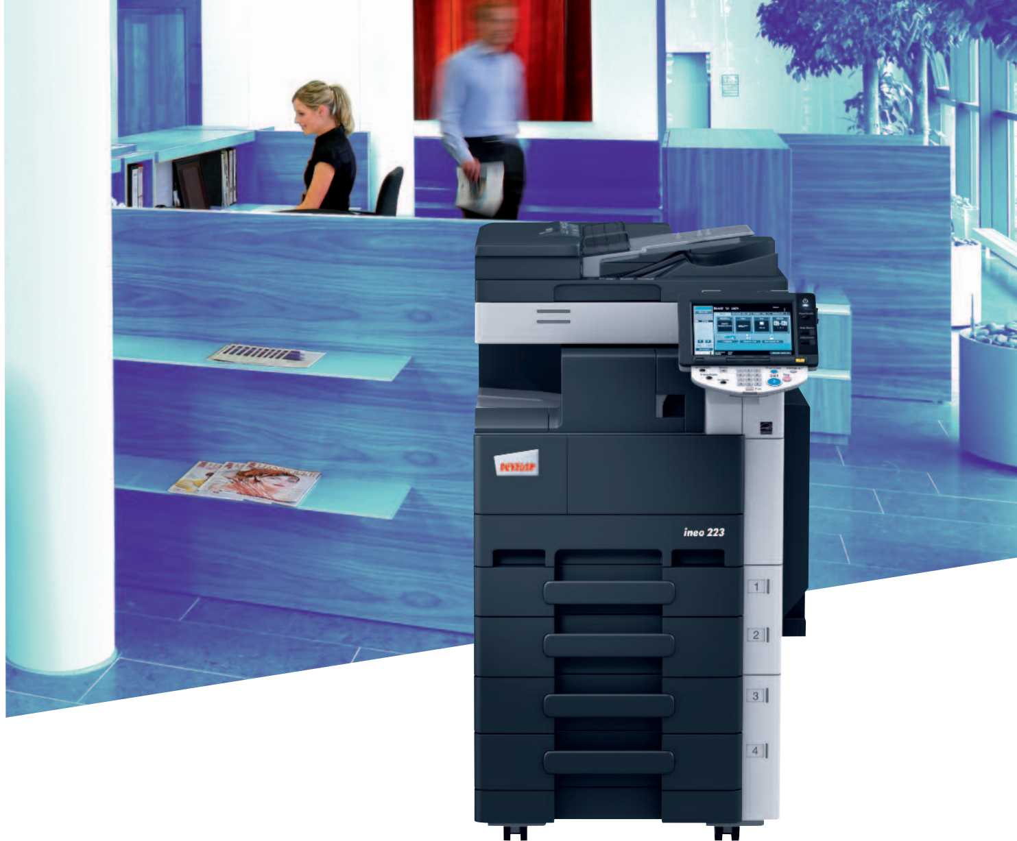
ineo 223 s vestavěným finišerem (FS-529), dvojitou kazetou na papír (PC-208) a podavačem originálů (DF-621)