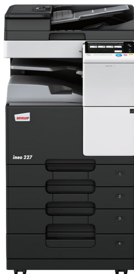
ineo 227 s oboustranným podavačem originálů (DF-628), oddělovací přihrádkou (IS-506) a dvěma přidavnými kazetami (PC-213)

Technologie NFC zabudovaná přímo do panelu zajišťuje, že dokumenty z vašeho Android zařízení vytisknete nebo naskenujete pouhým přiložením mobilu. Pro Apple zařízení tu je zase Bluetooth LE*. Díky oběma technologiím se můžete mobilem také přihlásit. Váš mobilní telefon tak zcela dokáže nahradit firemní čipovou kartu.