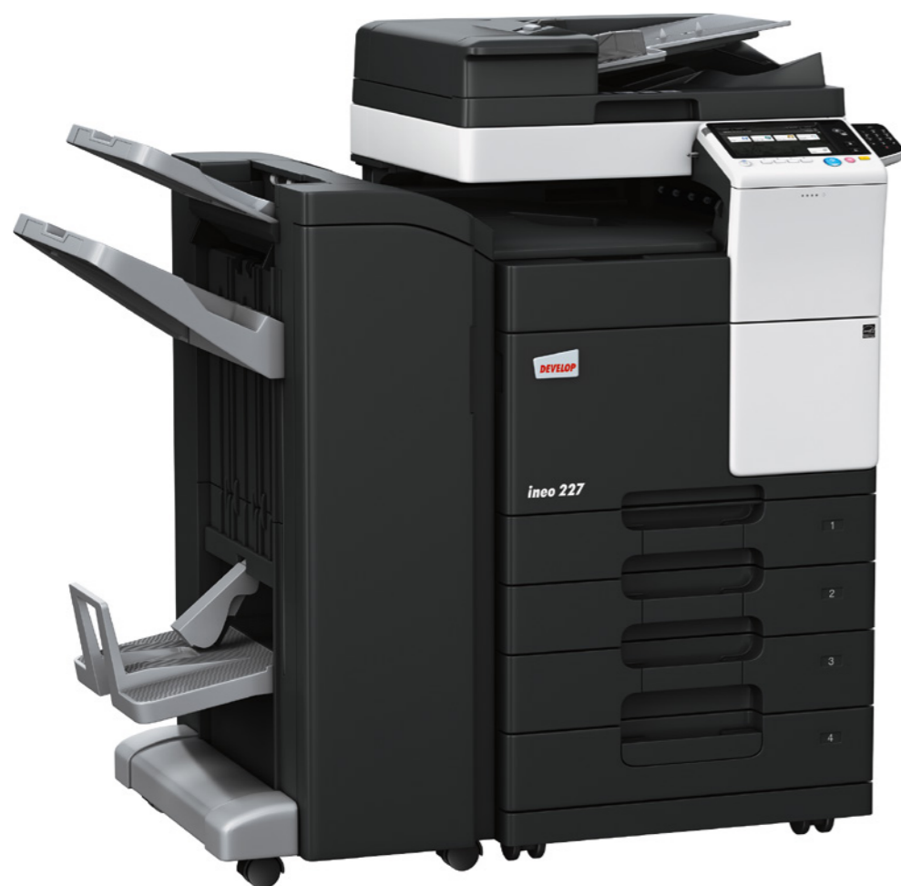
ineo 227 s podavačem originálů (DF-628), brožovací finišerem (FS-534SD), dvěma přídatnými kazetami (PC-213) a číselnicí (KP-101)

Úsporná elektronika a okamžité vypínání částí stroje, které nejsou právě používány, zajišťují ještě podstatně nižší spotřebu energie, než vyžadují ekologické standardy Energy Star a Blue Angel. Provoz stroje vás tak vyjde na méně než 1 Kč denně. Vaši kapsu i přírodu šetří také další funkce, jako například automatické odstranění prázdných stránek, zabráňující zbytečnému kopírování a plýtvání papírem. Používaný toner obsahuje biomasu a díky své nižší zapékací teplotě je velmi šetrný k životnímu prostředí.