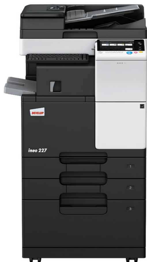
ineo 227 s oboustranným podavačem originálů (DF-628), vestavěným finišerem (FS-533), velkokapacitní kazetou (PC-413) a držákem klávesnice (KH-102)