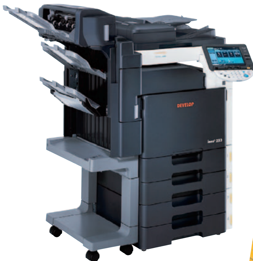
ineo+ 253 s podavačem originálů DF-611, vestavným finišerem FS-519, sadou pro sešítí a ohyb SD-505 a kazetou na 2x 500 listů papíru PC-204

U síťových funkcí je myšleno na usnadnění správy pro síťové administrátory. Samozřejmostí je rychlý přístup, jednoduchá integrace a přímočarý monitoring všech síťových systémů. ineo+ 253/353 umí e-mailem podávat zprávy o svém aktuálním stavu, umí identifikovat uživatele několika způsoby a evidovat nákladové účty. Možnost nastavení omezení pro sledované účty (např. pro barevný tisk) pomáhá redukcí nákladů, efektivní zabezpečení a šifrování zajistí, že důvěrná data důvěrnými zůstanou.