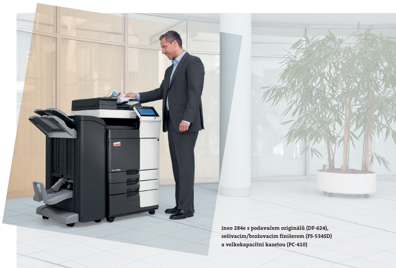
ineo 284e s podavačem originálů (DF-624), sešívacím/brožovacím finišerem (FS-534SD) a velkokapacitní kazetou (PC-410)

Tyto černobílé multifunkce obsahují nespočet různých úsporných funkcí, které pak ve výsledku sníží spotřebu elektrické energie až o 40% v porovnání s předchozí řadou. Zatímco tento pohled na věc šetří vaše peníze, jiné „zelené“ funkce jsou ekologicky prospěšné. A to znamená, že řada DEVELOP ineo „e“ přináší úsporu nejen životnímu prostředí, ale také zvyšuje ekologický kredit svého majitele.