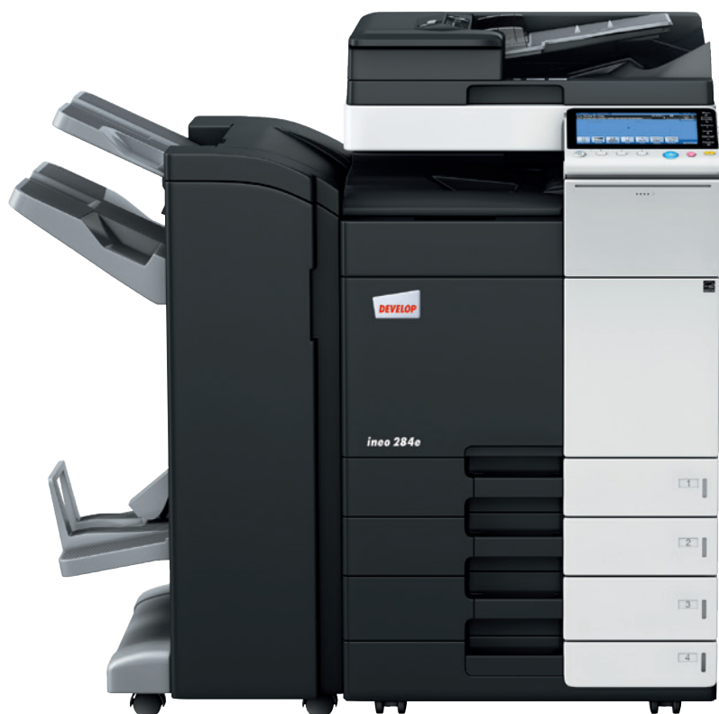
ineo 284e s jednoprůchodovým podavačem originálů (DF-701), dvěma přídatnými kazetami (PC-210) a sešivacím/brožovacím finišerem (FS-534SD)

Každé z těchto multifunkčních kancelářských zařízení, ať už je to ineo 224e, ineo 284e, ineo 364e, ineo 454e nebo ineo 554e, se nejen velmi snadno používá, ale nabízí také bohaté množství šikovných funkcí, které usnadňují každodenní kancelářskou práci. Ať už tedy potřebujete tisknout, skenovat, kopírovat, faxovat nebo posílat emaily, ineo vám pomůže optimalizovat práci ve vaší kanceláři.