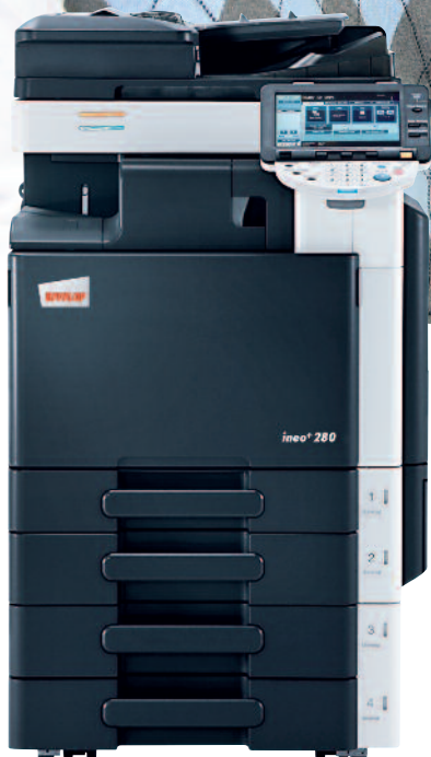
ineo+ 280 s podavačem originálů (DF-617), interním finišeřem (FS-529) a univerzálním zásobníkem na 2x 500 listů (PC-207)