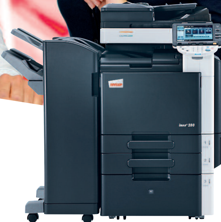
ineo+ 280 s podavačem originálů (DF-617), podlahovým finišeřem (FS-527) a velkokapacitním zásobníkem (PC-408)