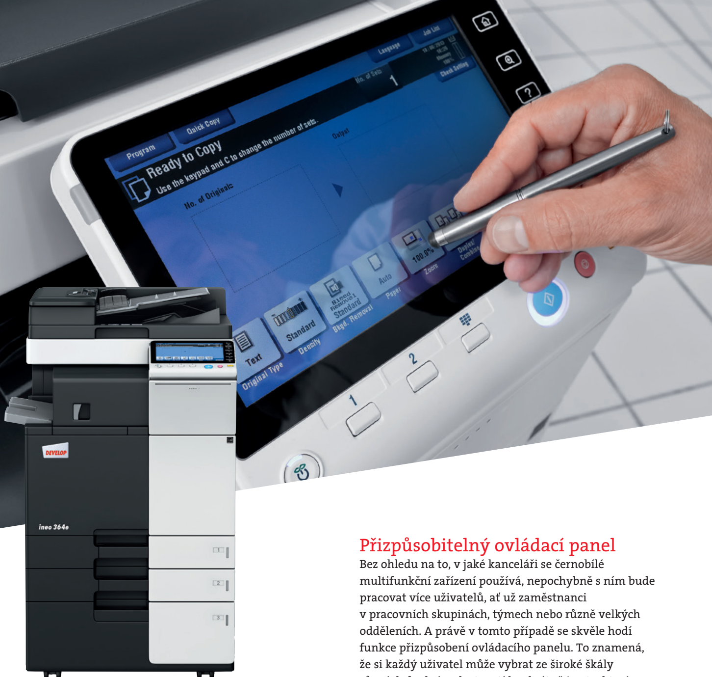
ineo 364e s podavačem originálů (DF-624), velkokapacitní kazetou (PC-410) a vestavným finišerem (FS-533)