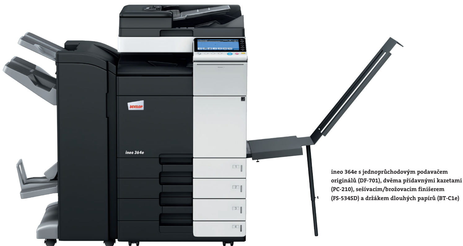
ineo 364e s jednorůchodovým podavačem originálů (DF-701), dvěma přídatnými kazetami (PC-210), sešivacím/brožovacím finišerem (FS-534SD) a držákem dlouhých papírů (BT-C1e)

Každé z těchto multifunkčních kancelářských zařízení, ať už je to ineo 224e, ineo 284e, ineo 364e, ineo 454e nebo ineo 554e, se nejen velmi snadno používá, ale nabízí také bohaté množství šikovných funkcí, které usnadňují každodenní kancelářskou práci. Ať už tedy potřebujete tisknout, skenovat, kopírovat, faxovat nebo posílat emaily, ineo vám pomůže optimalizovat práci ve vaší kanceláři.