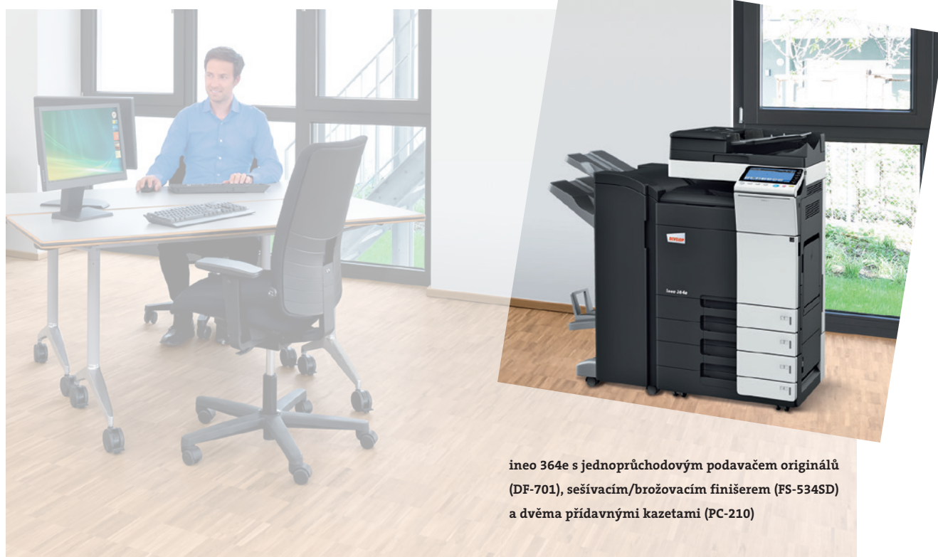
ineo 364e s jednorůchodovým podavačem originálů (DF-701), sešivacím/brožovacím finišerem (FS-534SD) a dvěma přídatnými kazetami (PC-210)

Tyto černobílé multifunkce obsahují nespočet různých úsporných funkcí, které pak ve výsledku sníží spotřebu elektrické energie až o 40% v porovnání s předchozí řadou. Zatímco tento pohled na věc šetří vaše peníze, jiné „zelené“ funkce jsou ekologicky prospěšné. A to znamená, že řada DEVELOP ineo „e“ přináší úsporu nejen životnímu prostředí, ale také zvyšuje ekologický kredit svého majitele.