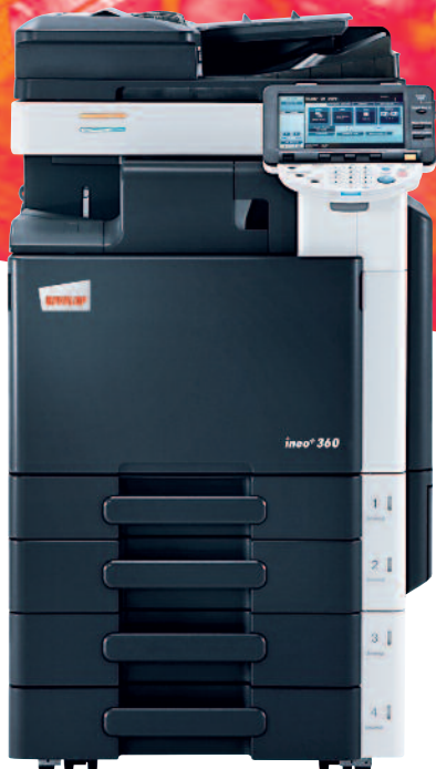
ineo+ 360 s podavačem originálů (DF-617), interním finišerem (FS-529) a univerzálním zásobníkem na 2x 500 listů (PC-207)