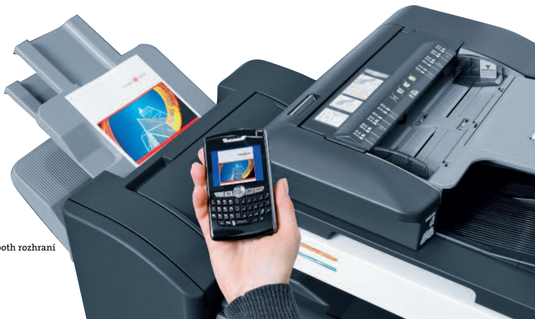
Tisk z mobilu pomocí přídavného Bluetooth rozhraní