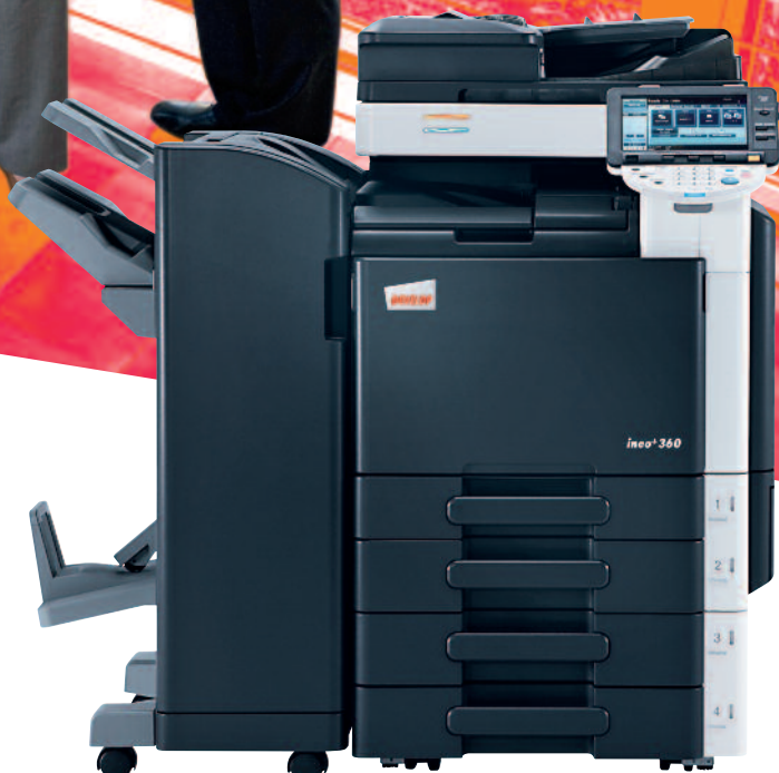
ineo+ 360 s podavačem originálů (DF-617), podlahovým finišerem (FS-527) s brožovacím modulem (SD-509) a s univerzálním zásobníkem na 2x 500 listů (PC-207)